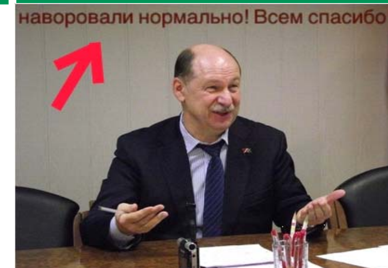
*Группа Vkontakte.ru "Я люблю Наро-Фоминск" Глава района подводит итоги года